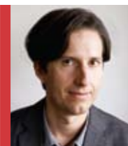
Szerző: Papp-Váry Árpád Budapesti Kommunikációs és Üzleti Főiskola, marketingintézet-vezető

A nők elcsábítását Casanova óta kutatják. Egy kanadai bűvész, Mystery igen közel került a megfejtéshez, és az elmúlt években egy egész iparág épült fel az alapelveit követve.